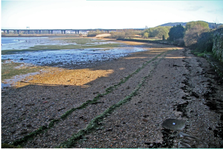
8-Ribeira da Mercedes