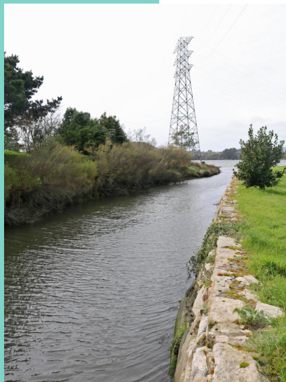
Un dos brazos da desembocadura do Río Bellele.