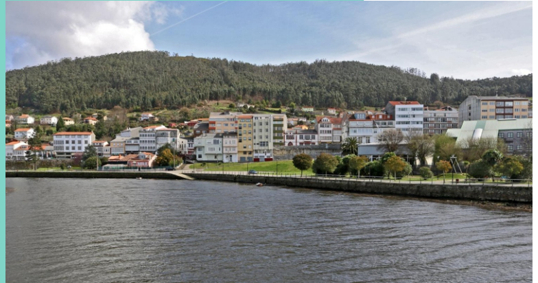
Ribeira da Toeira