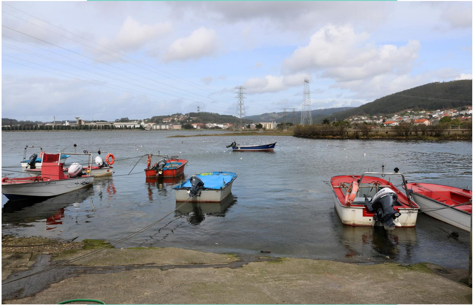
Porto de Neda