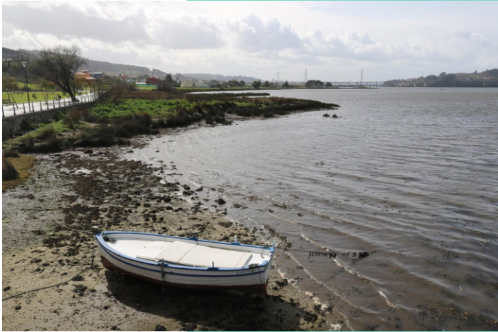
3- O Empedrón