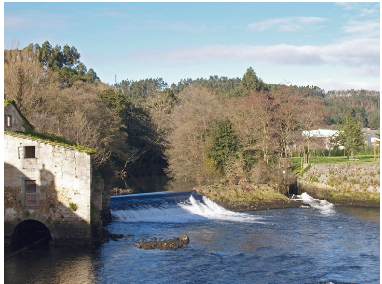
1-RÍO GRANDE DE XUVIA. Nace nos montes de Serra en terras das Somozas e, despois de 31 km, desemboca na Ría do Ferrol, entre Narón (Xuvia) e Neda.