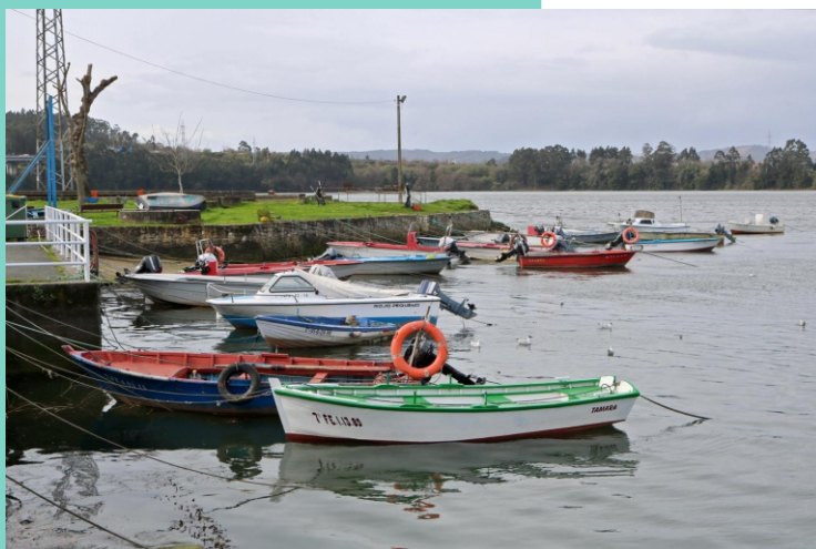
Porto de Neda