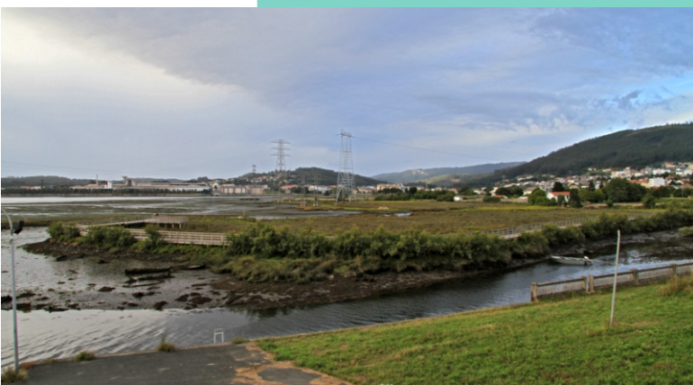
6-Ribeira de Santa María