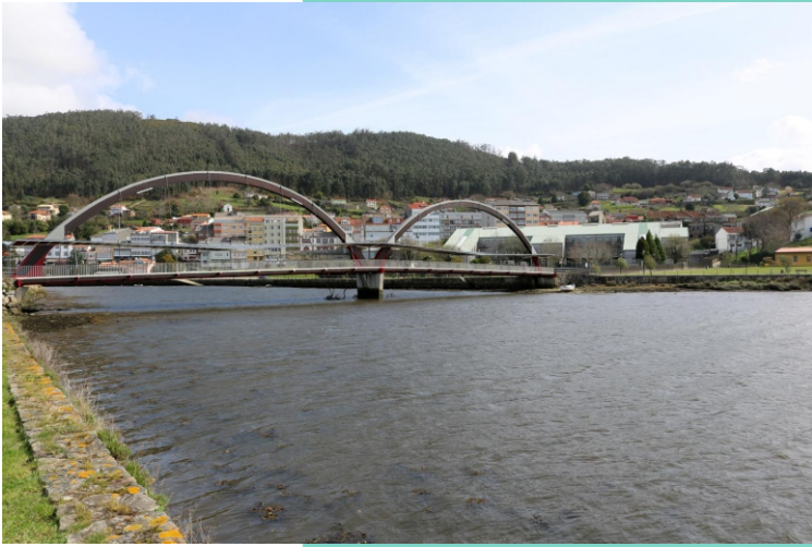
Ponte peonil do paseo marítimo Neda-Narón