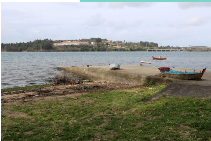
Porto do Puntal de Abaixo