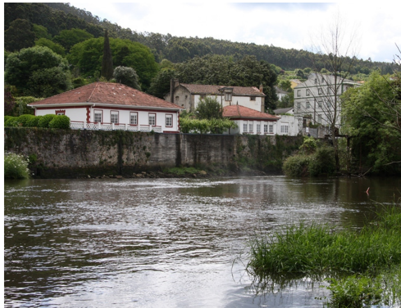
Desembocadura do río Grande de Xuvia. Coas súas augas funcionou desde 1903 a Real Fábrica, que nos primeiros tempos foi de caldeirería de cobre, no 1909 de armas, logo de moeda e máis tarde fábrica textil.