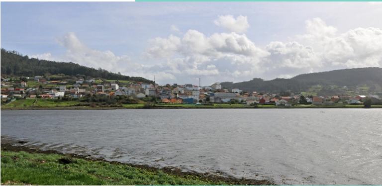
4-Ribeira do Coto