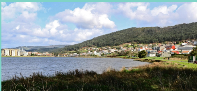
Costa de Neda

O litoral de Neda esténdese ao longo de 5 km pola marxe esquerda da ría de Ferrol entre a desembocadura do río Grande de Xuvia e o Puntal de Abaixo. Un tramo de litoral de fondo de esteiro, con xunqueiras e fondos lamacentos, bastante lineal e uniforme, coa parte do esteiro do río Grande desnaturalizada por valados de contención; o esteiro do río Beelle, en estado casi natural, e un tramo de costa baixa pouco alterada.